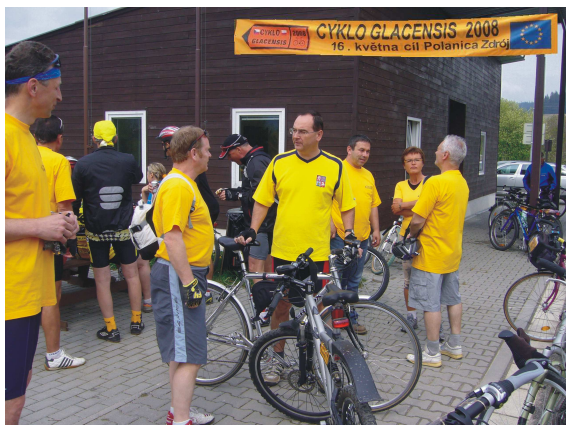
Cyklo Glacensis 2008