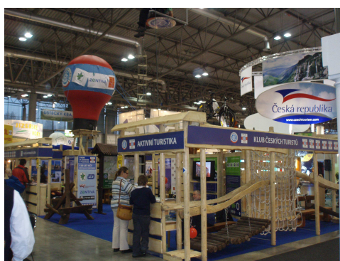
Presentace na veletrhu Regiontour Brno

V intencích rozpočtu a plánu činnosti proběhlo zajištění propagace, medializace a publicity ROT distribucí propagačních materiálů na stáncích Regiontour v Brně a Holiday World v Praze a formou speciálně vyrobených cyklo bilboardů na veletrhu For Travel v Praze – Letňanech.