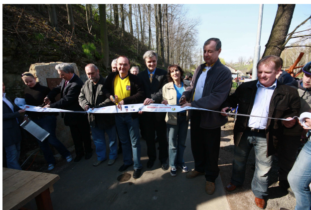
Slavnostní otevření 2. etapy cyklostezek