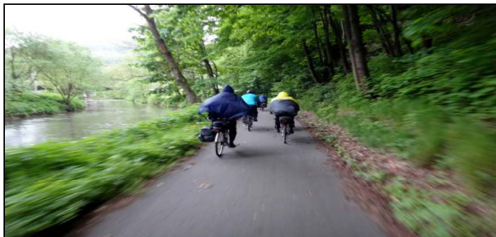
Počasí trápilo účastníky od začátku, 16.5.2014

ROT připravil na dny 16. a 17. května 2014 již 13. ročník mezinárodní cyklistické akce CYKLO GLACENSIS, letos byla cílem polská Nowa Ruda a její místní část Ludwikowice Kłodzkie, areál Harenda, kde bylo připraveno ubytování a večerní program.