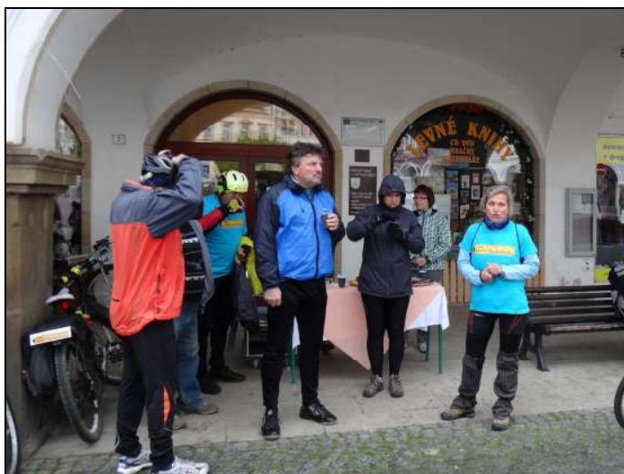
ilustrační foto ze startu v Ústí nad Orlicí

102 českých a 110 polských účastníků prověřilo chladné a deštivé počasí. České týmy z 11 měst (Brandýs n.O., Česká Třebová, Choceň, Králíky, Lanškroun, Náchod, Nové Město n. Metují, Bačetín, Ústí n.O., Vysoké Mýto, Žamberk) dorazily po náročné jízdě do cíle ve velmi dobré náladě a kondici. Některé týmy urazily ve vytrvalém dešti 90 až 110 km, některé využily doprovodného vozidla nebo železnice a část trasy nahradily dopravním prostředkem. V roce 2015 bude cíl Cyklo Glacensis na české straně hranice a organizátor Region Orlicko-Třebovsko na příští ročník všechny účastníky srdečně zve.