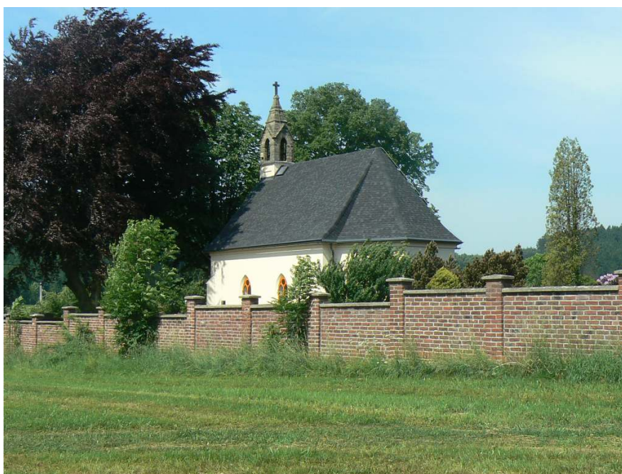
Velká Skrovnice – kaplička a hřbitovní zeď