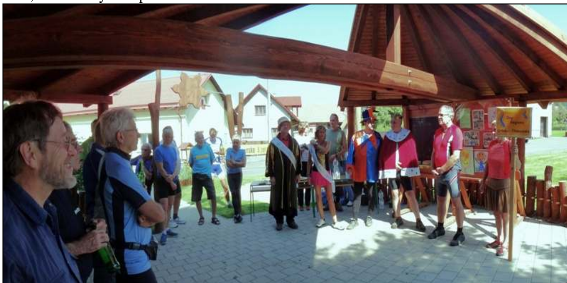
Snímek z uvítání na startu v Říčkách, 5.9.2014

Den regionu Orlicko – Třebovsko tak potvrdil, že přínosy svazku jsou nejenom duchovní a duševní, ale také vysoce pozitivně materiální.