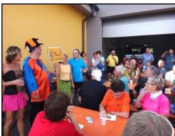
Start v Českých Libchavách

Z Ústí nad Orlicí se cyklisté vydali na Hrádek (tam byla nutná občerstvovací pauza) a přes Šuránkův kopec ve Sloupnici k cíli do Řetové – nejprve ke kostelu a po té na hřiště u obnovené tělocvičny, kde byla jízda letos zakončena kulturním programem se skvělou ukázkou jezdecké drezúry a s tradičním závěrečným debatováním při občerstvení.