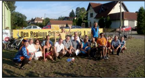
Cíl s bohatým programem v Řetově