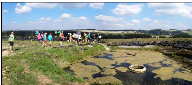
Exkurze v Ekole České Libchavy