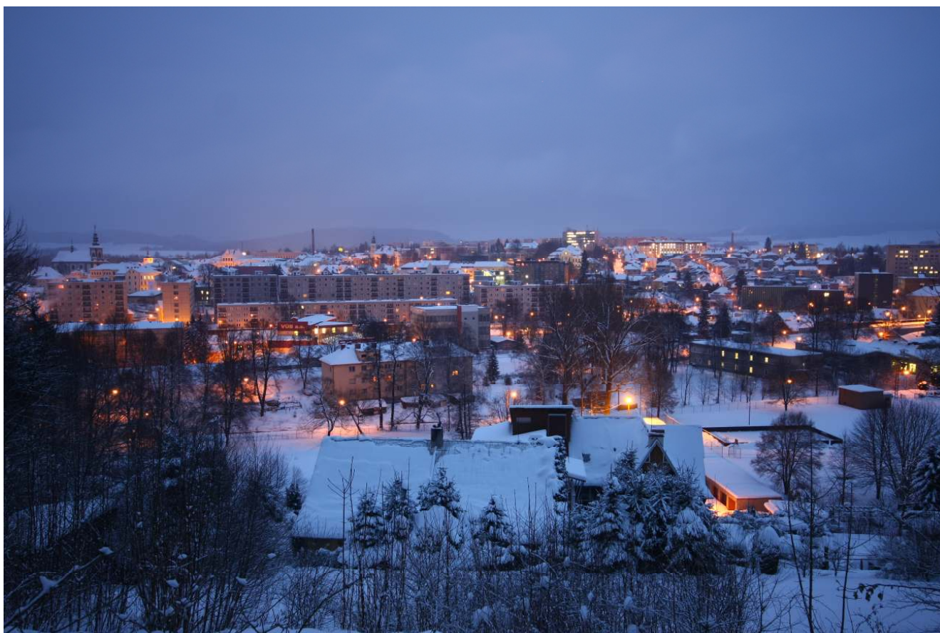
Ústí nad Orlicí v zimě