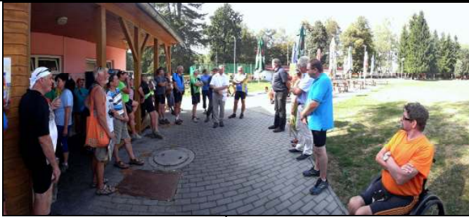
Hřiště Tepvos – Aquapark Ústí nad Orlicí