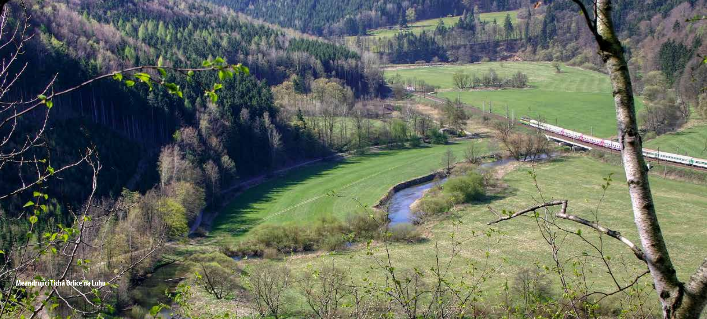
Meandrující Tichá Orlice na Luhu