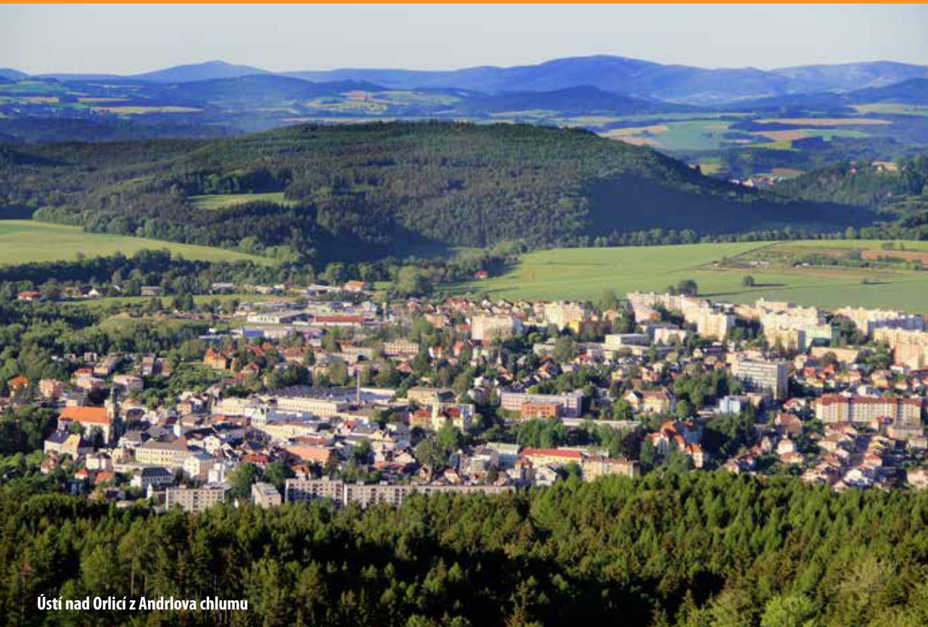
Ústí nad Orlicí z Andrlova chlumu