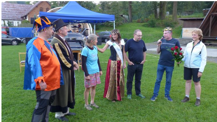
Z programu na starém hřišti v Dlouhé Třebové