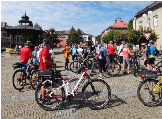
Přivítání na náměstí v Brandýse nad Orlicí

V roce 2020 slavil Region Orlicko – Třebovsko 20 let od svého založení. Hlavní akce oslav výročí byla připravena na pátek 11. září 2020 od 16 hodin v Dlouhé Třebové na Starém hřišti . Program zahájil peloton cyklistů, kteří do areálu dorazili z Brandýsa nad Orlicí, kde začaly oslavy 20 LET REGIONU. – Celý text je uveden v bodě II/13, zde přidáváme ukázkou fotografií.