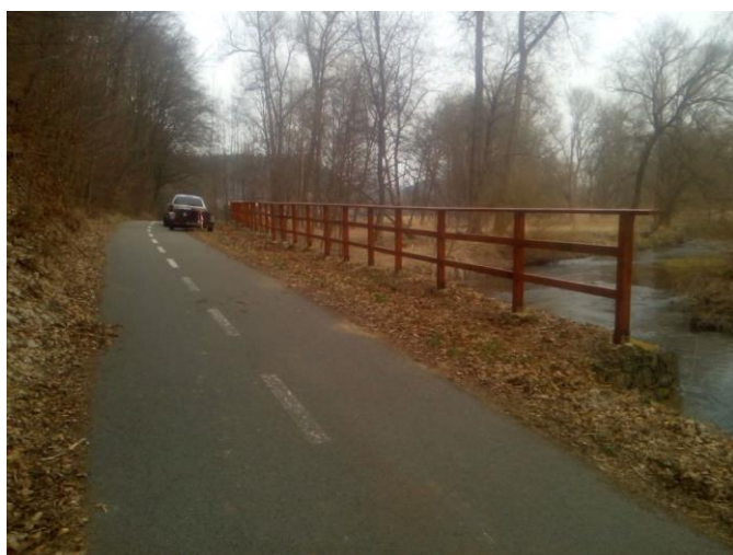
foto: obnovené zábradlí v Červené u Letohradu

Snahu regionu podpořil prostřednictvím dotace z Programu obnovy venkova i Pardubický kraj, a to částkou ve výši bezmála 137 tis. Kč.