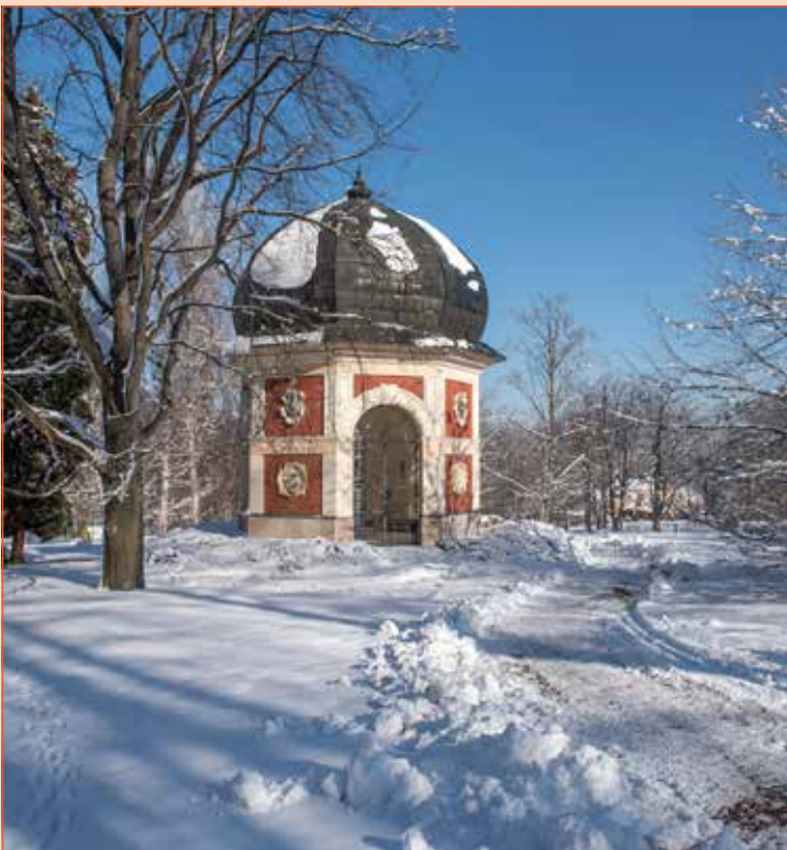
ČESKÁ TŘEBOVÁ • Park Javorka v zimě