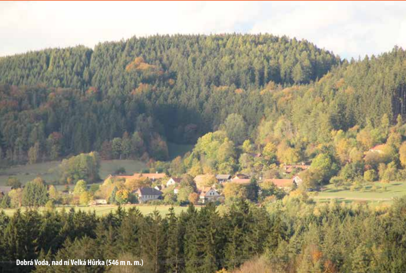
Dobrá Voda, nad ní Velká Hůrka (546 m n. m.)